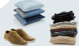
Vêtements - chaussures - linge propres et emballés dans des sacs plastique