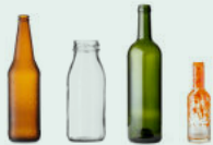
Bouteilles en verre - bocaux - flacons vidés non lavés sans bouchons ni couvercles