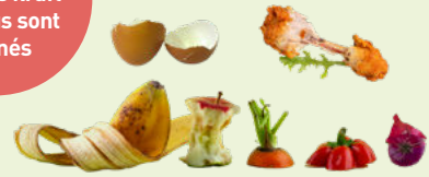
Restes alimentaires - épluchures fleurs fanées - coquilles d'œufs - restes de viande poisson et coquillages

À déposer dans les sacs kraft qui vous sont donnés